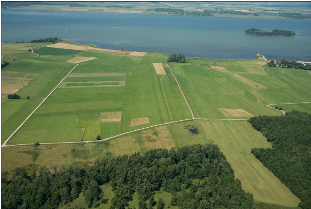
Het (noord)oostelijke deel van het gebied Veluwemeerkust, met linksboven het mondingsgebied van de Hierdense beek. Op de voorgrond de bospercelen Grote Weiland en Bloemkampen, met daarboven de Munnekesteeeg die vanaf Hierden richting Bad Hoophuizen (rechts) loopt.

Onze dank gaat uit naar de medewerkers van het beheerteam Noordwest-Veluwe van Natuurmonumenten, voor de hulp in de voorbereiding en uitvoering van deze inventarisatie. Daarnaast bedanken wij alle deelnemers die aan de inventarisatie een bijdrage hebben geleverd.